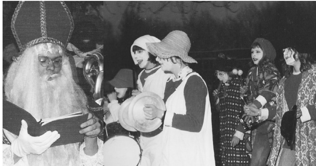
Sint Michiel en de Witte Pieten